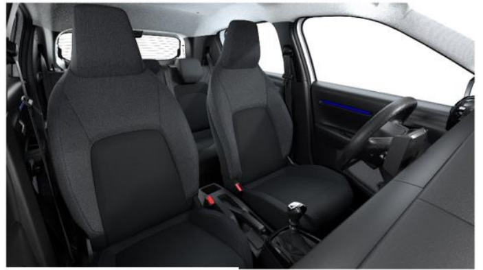
Ambiente YOU - Stoff Schwarz/Grau