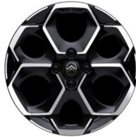
17-Zoll-Leichtmetallfelgen Atacamite mit Diamantschliff