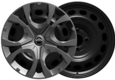
16-Zoll-Stahlfelgen mit Radzierkappen Pyrite in Mattschwarz