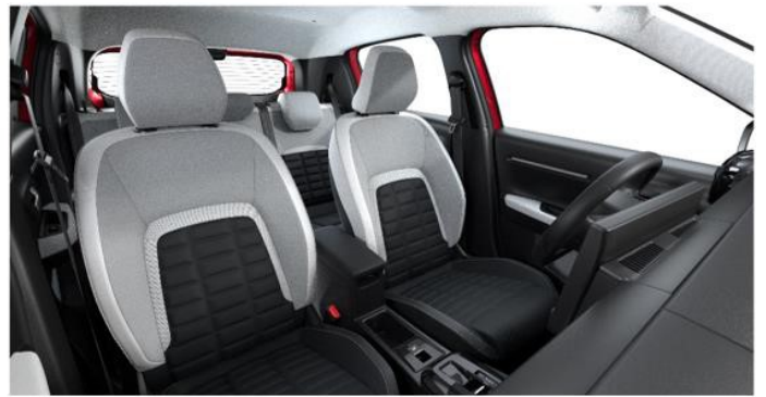
Ambiente METROPOLITAN GREY - Stoff-/Kunstlederbezug Metropolitan Grey