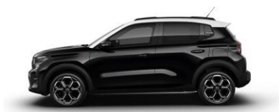
Perla Nera Schwarz (M)