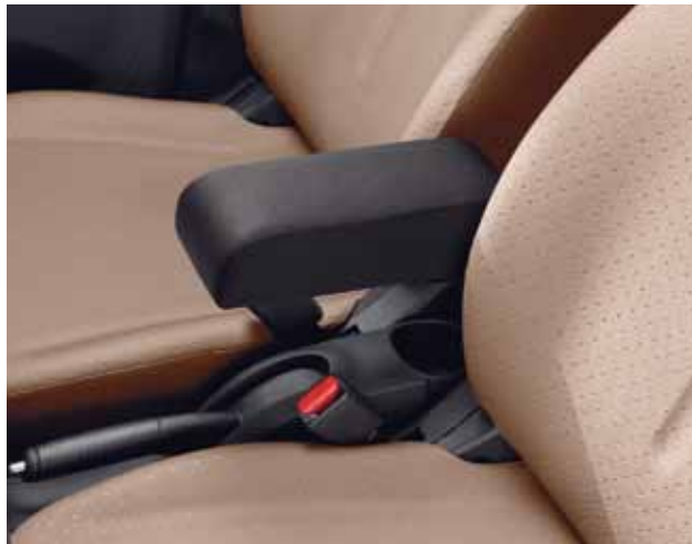
Mittelarmlehne Bestell-Nr.: 944020