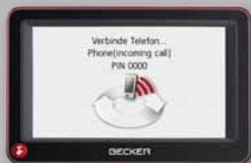
Navigationssystem Becker „Active 43 Talk“