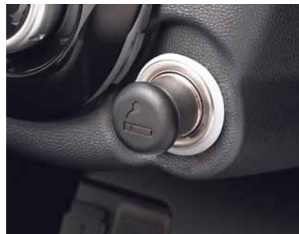
Zigarettenanzünder Bestell-Nr.: 9425E9