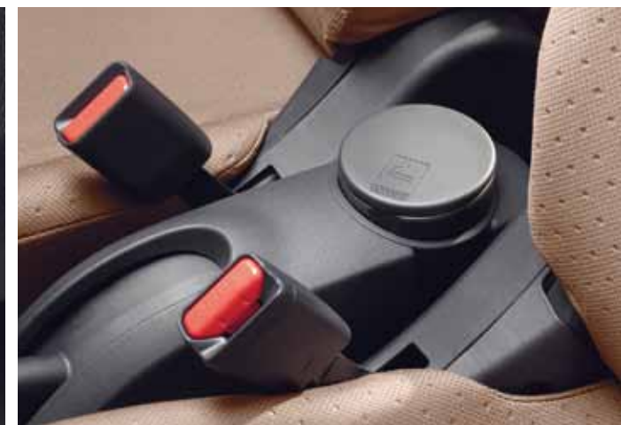
Aschenbecher Bestell-Nr.: 962395 Passender Halter für Aschenbecher – Bestell-Nr.: 962396